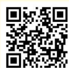
久々子湖・日向湖コース (14km)